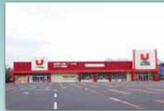
ユニバース青山店/400m