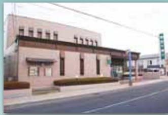
岩手銀行青山町支店/270m