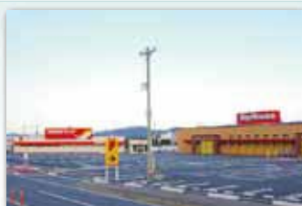
ビッグハウス青山タウン/520m